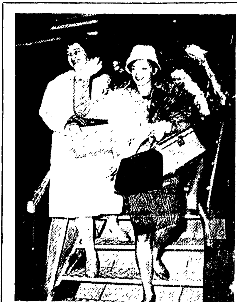
Elena Popova e Jana Brejchova nelle scene del film "Il tempo di musica"...